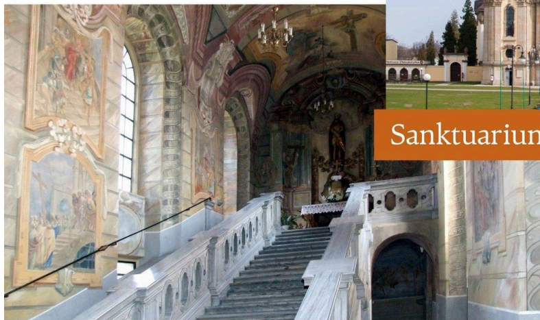
Sanktuarium Świętych Schodów w Sońnicy